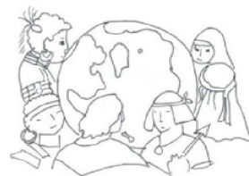
Tous frères nés d'un même Père

Pour les hommes et pour les femmes, Pour les enfants de la terre Ton Église qui t'acclame, vient te confier sa prière.